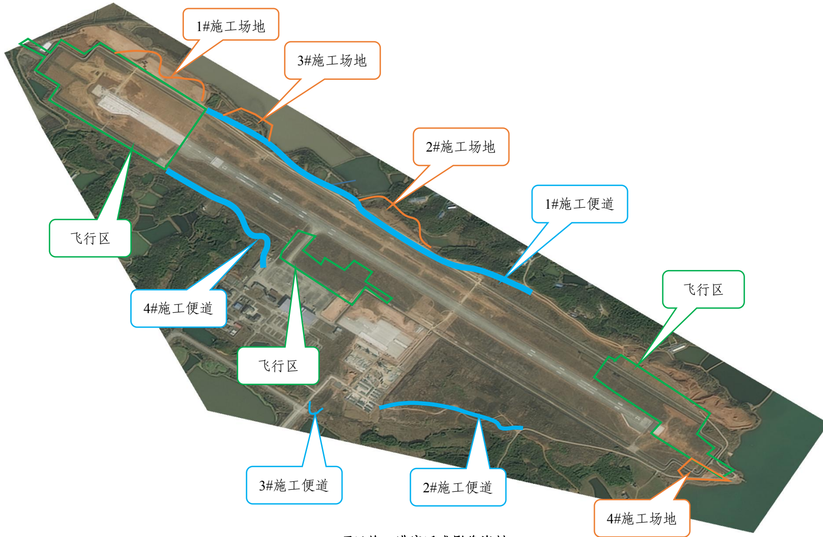
项目施工进度遥感影像资料